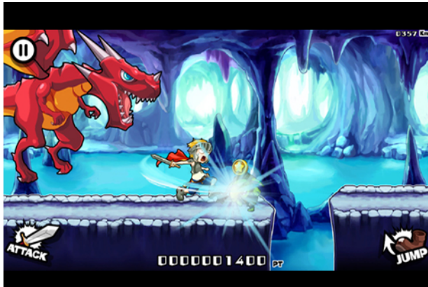
▲ プレイ画面 ▲